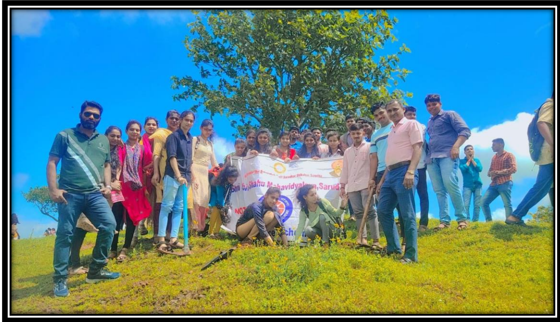
Tree Plantation at College